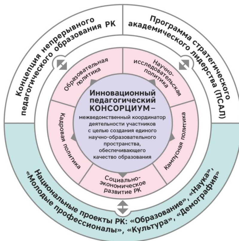
Рис. 1. Модель концепции программы развития Института педагогики и психологии Петрозаводского государственного университета Fig. 1. The concept model of the Institute of Pedagogy and Psychology of Petrozavodsk State University development program

Программа развития Института педагогики и психологии ПетрГУ разработана на основе проектно-целевого подхода. Одной из ее стратегических целей, наряду с реализацией Программы стратегического академического лидерства (ПСАЛ) и реализацией национальных проектов, является развитие пространства открытого непрерывного педагогического образования региона – Республики Карелия (рис. 1).