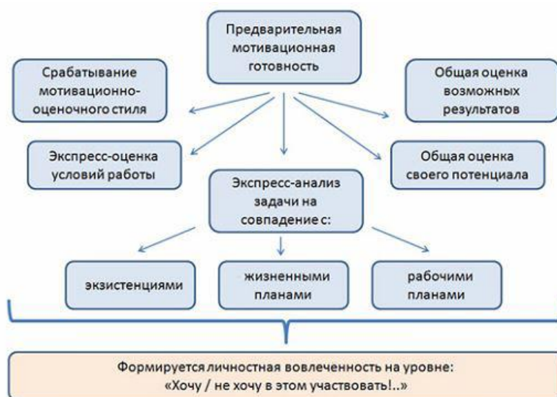
Рис. 1. Модель формирования мотивации предварительного уровня

Отказ может произойти по причине мировоззренческой (зимой животным в лесу и так тяжело, а тут еще и мы с ружьями), по причине несовпадения с планами на будущее (у меня в марте сессия, лучше к лету быть с дипломом, чем с косулей в морозилке) и в связи с банальной занятостью неотложными делами (если к понедельнику не переклею обои на кухне, то теща прострелит мне мозги безо всякого ружья).