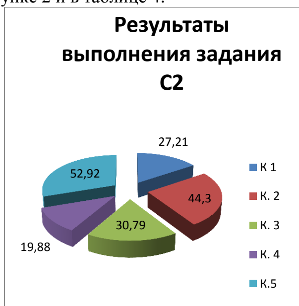
Рис. 2. Результаты выполнения задания C2 «Высказывание с элементами рассуждения» 1

Выполнение письменного задания экзаменационной работы оценивается на основе пяти критериев, а именно: решения коммуникативной задачи (содержание письменного высказывания), организации текста, используемой лексики, грамматики, орфографии и пунктуации. Данные в процентном соотношении представлены на рисунке 2 и в таблице 4.