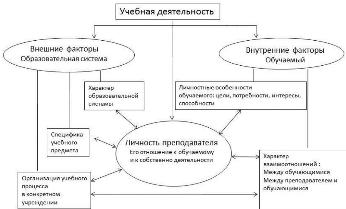
Рис. 1. Факторы мотивации учебной деятельности

Работа в системе неформального образования с пожилыми людьми имеет свои особенности, в том числе в области мотивации. Однако вопрос о личности педагога как факторе учебной мотивации пожилых изучен недостаточно. Нам показалось интересным обратиться к этой проблеме в контексте обучения репатриантов в системе неформального образования в Израиле, где педагог не только передает знания репатриантам-пенсионерам, но и организует их самостоятельную образовательную деятельность, формирует внутреннюю мотивационную сферу, способствует совершенствованию личностных качеств, необходимых в новой стране. Главная задача при этом – привлечь репатриантов к систематическим занятиям, помочь им преодолеть внутренние негативные стереотипы («поздно учиться в нашем возрасте»), обрести уверенность в своих силах, сформировать положительную мотивацию к учению. Как показывает практика, формирование положительных мотивов учения оказывает влияние на всех участников учебного процесса – и педагогов, и обучающихся.