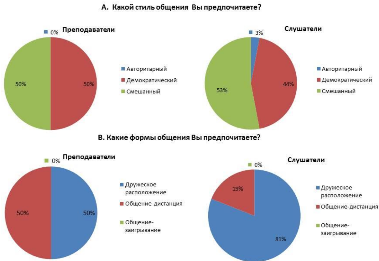
Рис. 2. Предпочитаемые стили взаимодействия между преподавателями и слушателями

Как видно из рисунка, ни один преподаватель не использует во взаимодействии со слушателями авторитарный стиль общения в чистом виде, но 3 % пожилых слушателей отдают ему предпочтение. Большинство преподавателей и обучаемых предпочитают демократический и смешанный стили общения. По результатам интервьюирования, дополнительно выяснилось, что слушатели считают необходимым привносить во взаимодействие элементы авторитаризма, основанные на авторитете и глубоких знаниях преподавателя. Педагоги же считают, что иногда необходимо настоять на своем мнении, не теряя при этом дружеского расположения и уважения к слушателям.