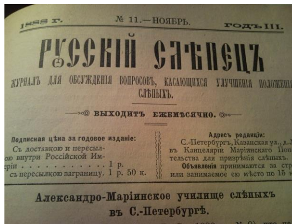
Рис. 2. Номер журнала «Русский слепец» 1888 г.

Особое внимание уделяется литературе, посвященной проблемам духовно-нравственной работы в обществе XIX – начала XX в. по привлечению внимания к проблемам незрячих и осуществлению реальных инициатив. Примером могут служить материалы о деятельности Константина Карловича Грота по активизации научного потенциала и общественных усилий в целях создания условий для развития образования, культуры, социальной направленности в отношении слепых. В строительстве школ, мастерских, центров для оказания помощи и развития самостоятельности незрячих и слабовидящих во II половине XIX в. включалось большое число энтузиастов, заложивших не только практический опыт работы, но и исследовательские подходы к изучению и всестороннему развитию в России лиц с проблемами зрения.