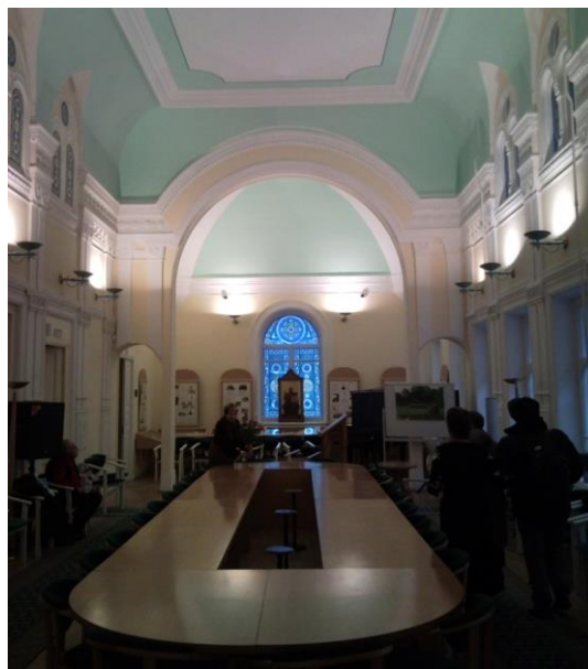
Рис. 4. Посетители музея истории образования слепых и слабовидящих

Подобные отзывы свидетельствуют об огромном воспитательном влиянии библиотеки на развитие гуманистической направленности молодого поколения и будущих специалистов социальной сферы.