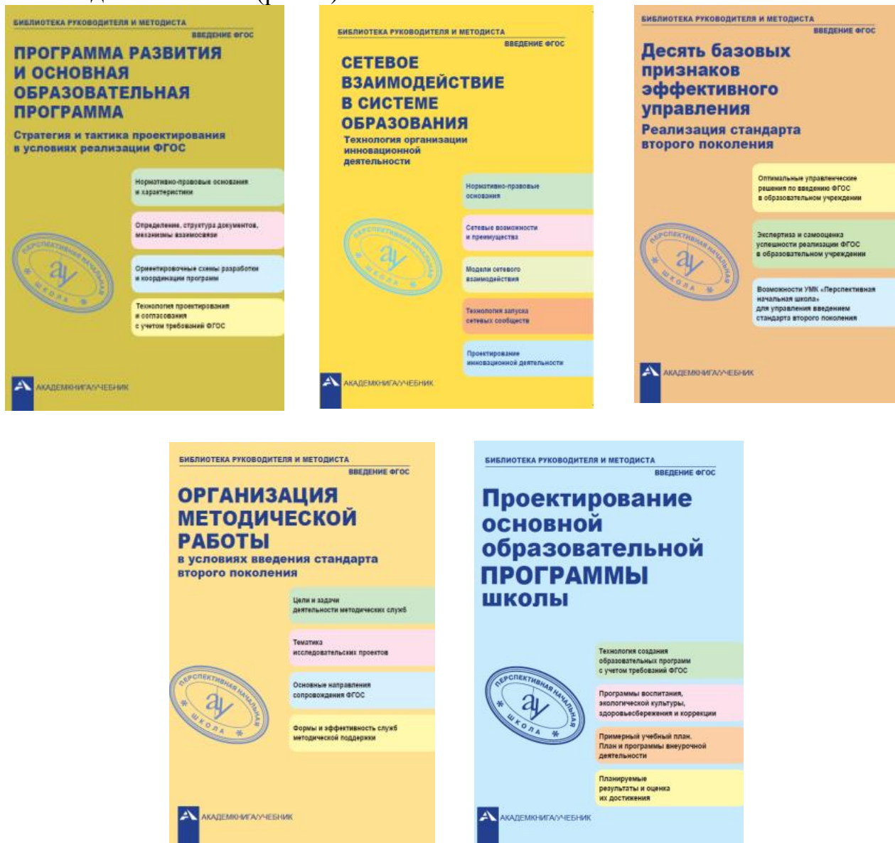
Рис. 1. Примеры изданий, выходящих в серии «Библиотека руководителя и методиста»

направленных на обсуждение актуальных управленческих и методических вопросов реализации ФГОС общего образования. В их работе принимают участие заинтересованные и компетентные в решении конкретных вопросов исследователи (как правило, от 25 до 50 человек). Они получают заранее подготовленные проекты проектировочных материалов, которые выступают содержательной основой деятельности, направленной на создание практико-ориентированного продукта, выпускаемого в рамках серии «Библиотека руководителя и методиста: Введение ФГОС» (рис. 1).